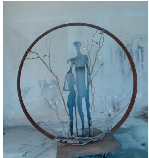
Florence de Ponthaud-Neyrat