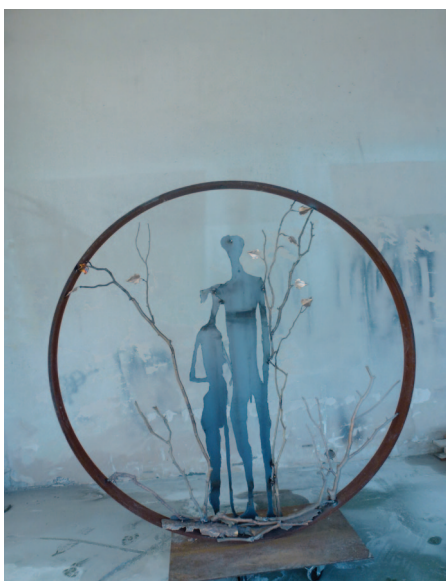
Adam et Eve au Paradis , 2012 bronze et métal découpé P.U. 1/1 - 210 x 30 x 200 cm

Florence de Ponthaud-Neyrat, sculpteur