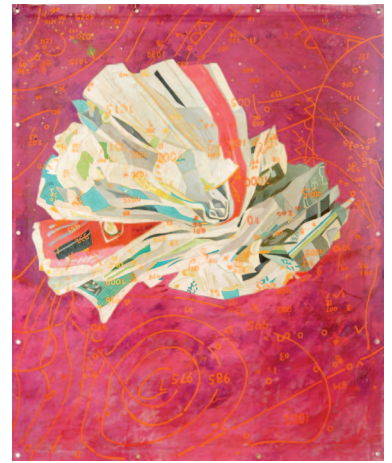
Véronique de Guitarre