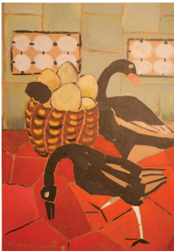
Caline de Gasquet